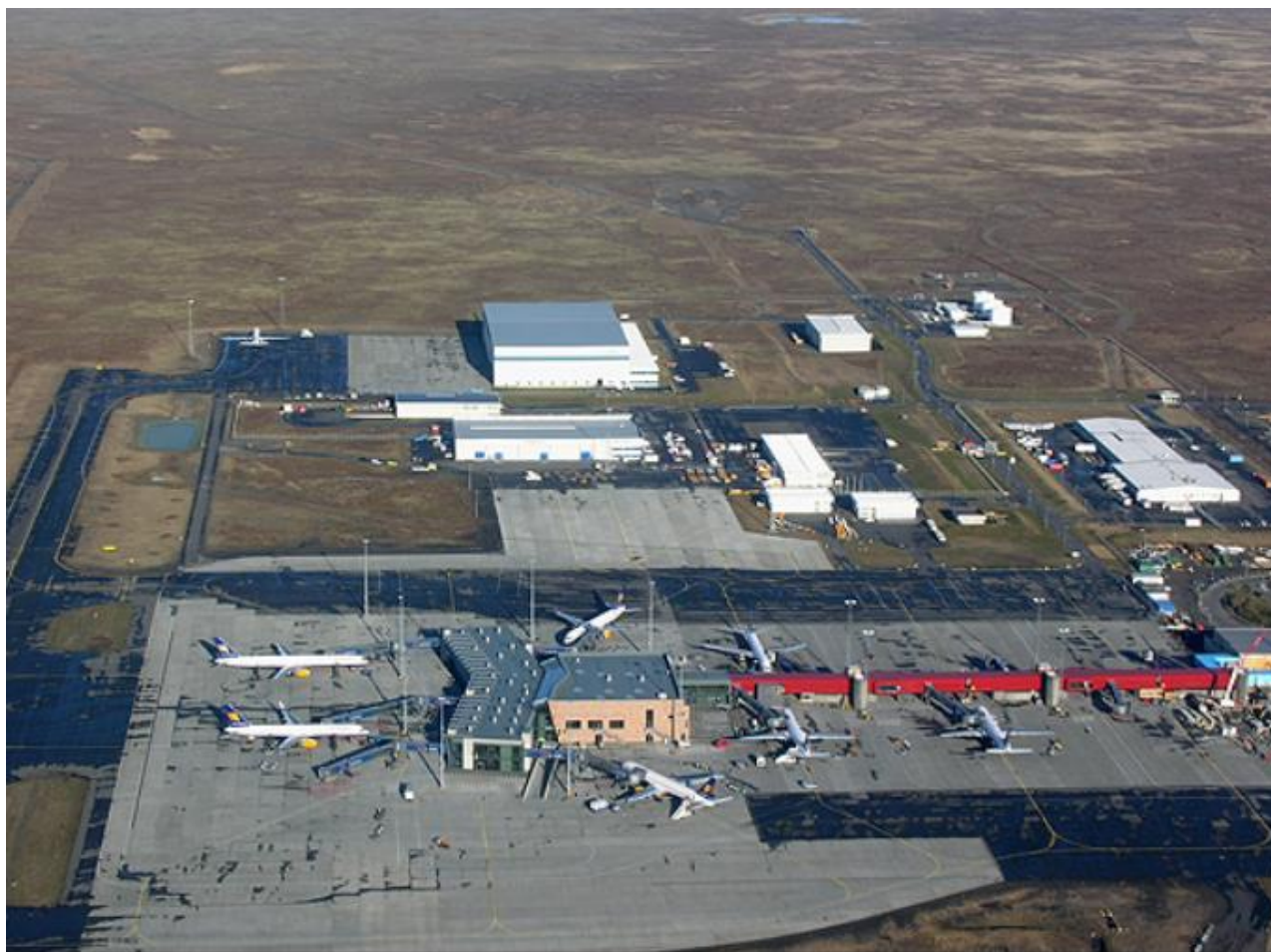
Gráfica 2: Aeropuerto Internacional de Keflavik